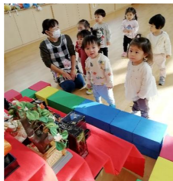
きれいなおひなさまを見て「ママー！」と指差す子どもも😊 豊かな心が育っています♪

ホールで体を動かして遊んだり、念願の雪遊びをしたりして、今月も元気に過ごしました。ひかり組で過ごすのもあと1か月。今度はにじ組さん！靴下をはこうとしたり、給食もスプーンを使って一人でたべたりと“自分で”と、身の回りのことにも意欲的！小さかったあの頃が懐かしく感じます。そんなひかり組は時々にし組さんのお部屋にお邪魔して、進級気分を味わいながら遊んでいます。にし組さんにあるおもちゃは新鮮で、あこがれ～子どもたちも進級を楽しみにしているようです。