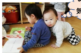
なんだか気持ちいいな～