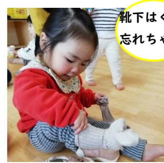
靴下はくのを忘れちゃった