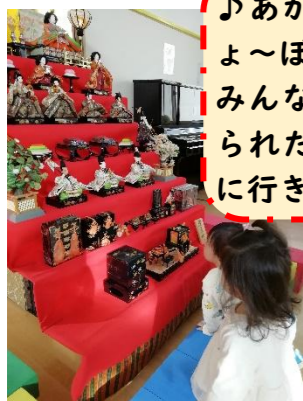
♪あかりをつけましょ～ぼんぼりに～♪ みんなでホールに飾られたひな人形を見に行きました。