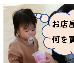
お店屋さんごっこ何を買おうかな～