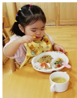
手づかみ食べが少なくなってきた、スプーンやフォークを使って食べるようになりました。