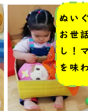
ぬいぐるみのお世話に大忙し！ママ気分を味わっている