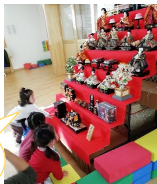
きれいだね～私も大きくなったら…