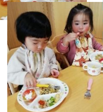
自分でエプロンを身に付け、椅子に座って待っている子どもたち、給食時間を楽しみにしているようです。

ひかり組さんになって、初めての園庭での雪遊び🌨️ジャンプスーツを着て、動きにくさを感じながらも、自分の足で雪の上を歩きました