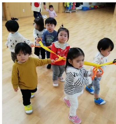
誘導ロープにつかまって歩くの、上手でしょ！？にし組さんになったら、誘導ロープにつかまってお散歩に行くの、楽しみだね♪