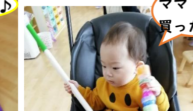
ママ！ネギ買ったよ～