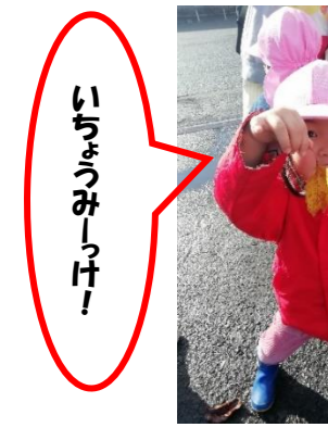
いちごうみーっけ！