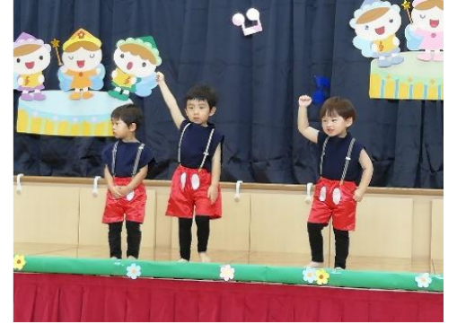
男の子はジャンボリミッキー！ 本物のミッキーみたいでとってもかわいいです♥

今月はなんとといっても1年の中でも一大イベントの発表会！毎日友達や保育士と一緒に踊りを楽しみました！衣装を身につけると子どもたちも気合が入るようで、予行練習では笑顔ではりきって踊る姿が見られました！本番はたくさんのお客さんを前に緊張したようで「ドキドキした」「恥ずかしかった」と話す子どもたちでしたが、それでも泣かずに最後までステージに立つことができ、成長を感じました💡