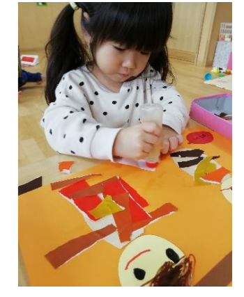
どこに何色の折り紙を貼ろうか… 一人一人自分の考えを表現しています💡