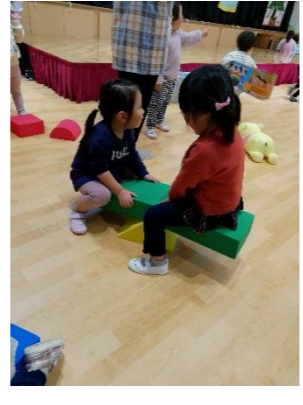
長い積木と三角の積木を組み合わせてシーソーを作っていました！発想がすごい！

お友達とイメージを共有しながら遊んでいる子どもたち。最近、レジャーシートを敷いてピクニックごっこやうちごっこをするのがフームです！バンダナを巻いてお店屋さんになりきったり、ブロックをろうそくに見立てて誕生日ケーキにしたり、いろいろな形の積木を組み合わせてシーソーにしてみたい…。アイデアがいっぱい出てくる子どもたちの思いに共感し、応えていきたいと思います😊