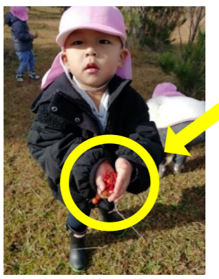
見て！いっぱい集めたよ！