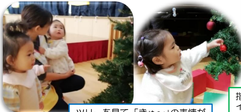
ツリーを見て、「きゃ〜」の表情がとっても かわいかったです