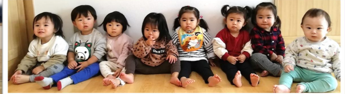
12月から、ぼくも仲間入りだよ😊よろしくね