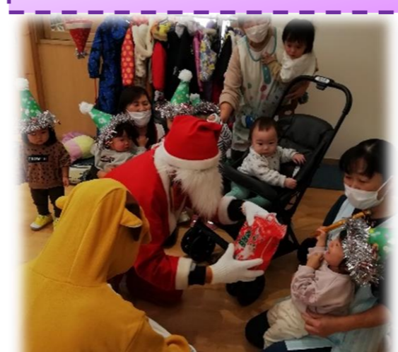
大きいサンタさんの登場に大泣きの子どもたち……これも、かわいい成長の思い出かな😊