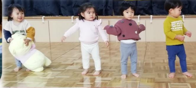
発表会を経験し、音楽が流れると、進んでステージに上がって踊る姿がみられました