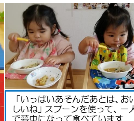
「いっぱいあそんだあとは、おいしいね」スプーンを使って、一人で夢中になって食べています