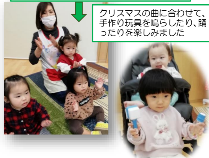
クリスマスの曲に合わせて、手作り玩具を鳴らしたり、踊ったりを楽しみました