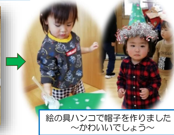
絵の具ハンコで帽子を作りました〜かわいいでしょう〜