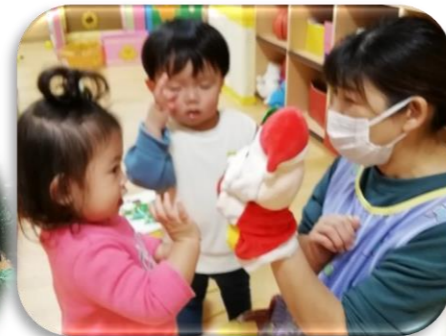
指人形でサンタさんやトナカイさんと遊び、クリスマスのイメージも膨らんでいました