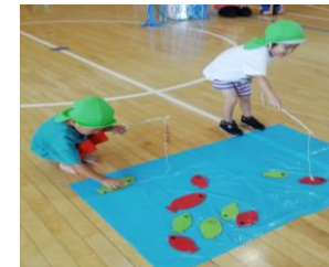
つき組 競技 魚釣り☆