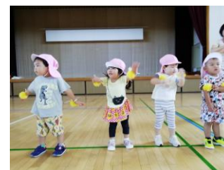
にじ・ほし組 アヒルサンバ

大成功に終わった運動会。この体験が心も身体も大きくなり次への自信に繋がっていくと思えます。沢山の応援ありがとうございました。 ※練習風景の一コマです。