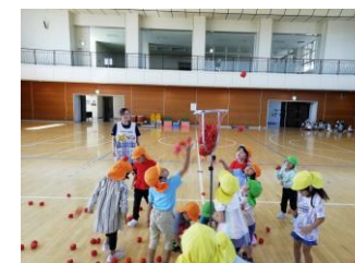
ダンシング玉入れ