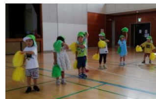
つき組 遊戯 アドベンチャー