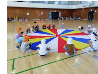
うみ・そら組 パラバルーン